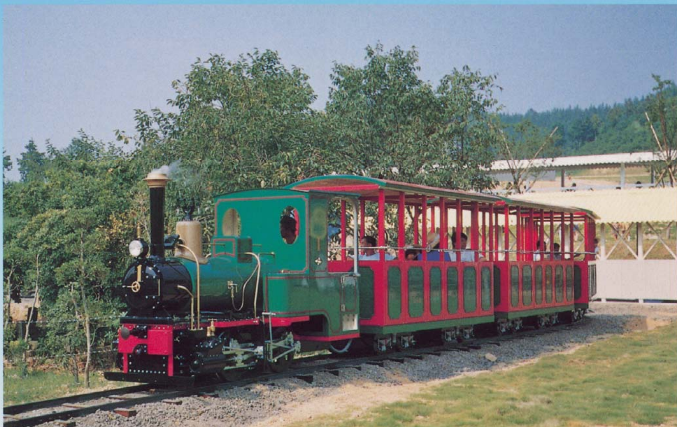
▲愛媛県温泉郡の「足立の庄」(西条金属株様経営)で「ぼっちゃん号」として大好評営業中。

伊予鉄道や大井川鉄道で知られるドイツ・クラウド社製の汽車のレプリカです。鉄道マニアのカメラの被写体として人気を博し、日本で最初に導入された外国製汽車としても有名です。そのヨーロッパ調の落ちついた雰囲気は、牧場やリゾート地などにもピッタリで、牧歌的な園内演出に最適です。客車は本格的な屋根付のボックスタイプで1輛12人乗り。最大5輛まで連結できますので稼働率は抜群です。また列車内の放送設備を生かして園内案内兼観覧用施設として使うことも可能です。