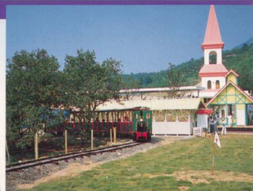
◀動力はプラットフォームにおける強制充電方式採用のためメンテは簡単。