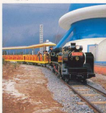
▼科学万博—つくば'85の『星丸ランド』でも運転。

《仕様》●サイズ=(機関車)幅1,050mm×長さ3,902mm×高さ1,470mm(炭水車)幅1,050mm×長さ2,200mm×高さ1,125mm(客車)幅1,050mm×長さ4,700mm×高さ2,115mm最小回転半径10m R(内側レール)●客車1輛12人乗り(6輛まで連結可能)●電源=第3軌条方式、バッテリー充放電方式 ●装備=走行音、汽笛、ヘッドライト、白煙装置、車内放送設備 ●オプション=踏切セット、トンネル、鉄橋、ステーション、クロスポイント、Y字ポイント。