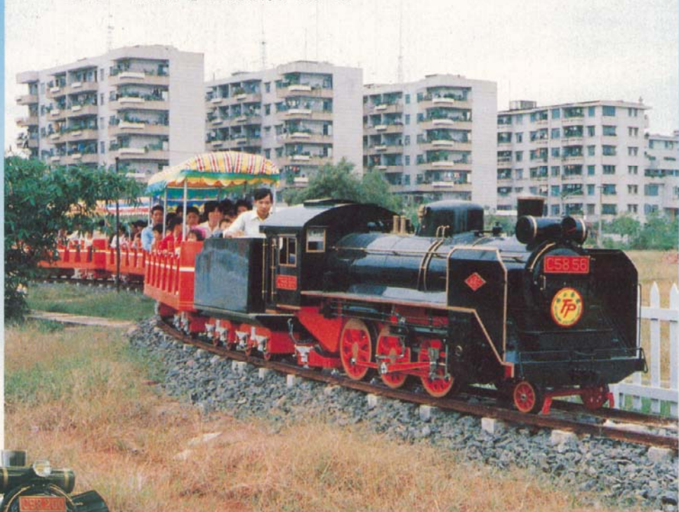
中国・佛山市の『佛山樂園』で人気を博すC58-56