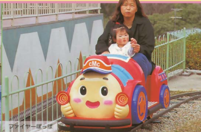
ファイヤーぽっぽ