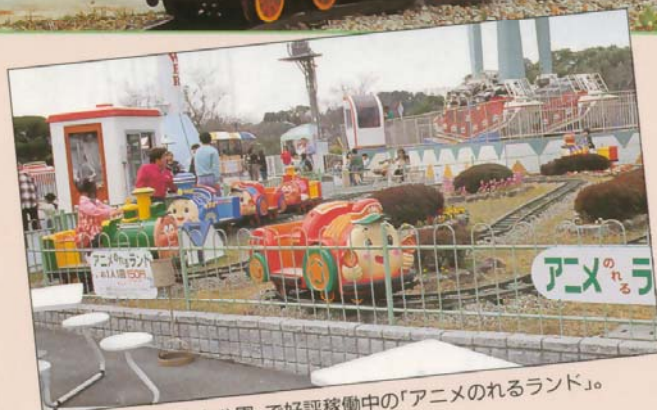
▲大阪府の「みさき公園」で好評稼働中の「アニメのれるランド」。