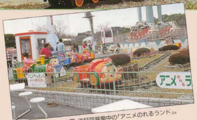
▲大阪府の「みさき公園」で好評稼働中の「アニメのれるランド」。