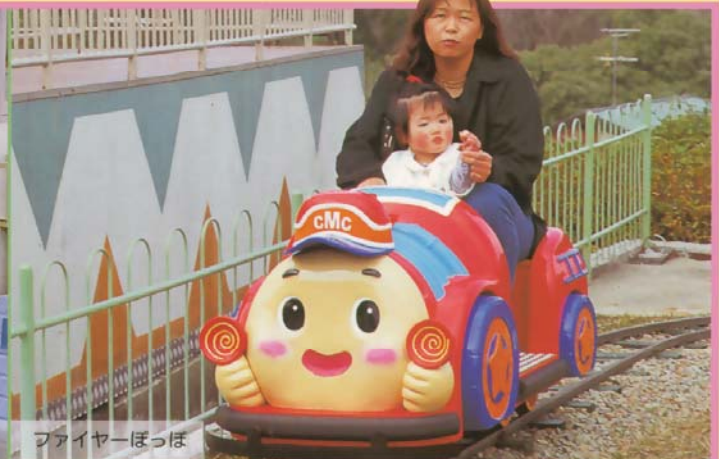
ファイヤーぽっぽ